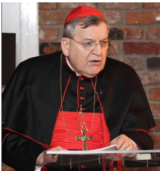
Il Card. Burke a Chester