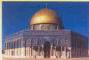
Gerusalemme—Moschea di Omar

“Il dialogo interreligioso a servizio della pacifica convivenza”