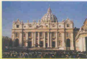
Roma— Basilica di San Pietro

Prefettura - Ufficio Territoriale del Governo di Ancona